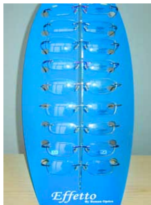
Espositore da banco